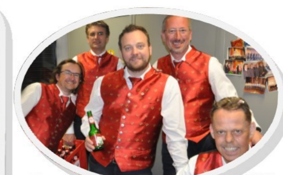
Der neue Vorstand nach der Wahl sichtlich erfreut.